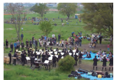
昨年の水辺コンサートの様子

もものひる / もものしきもの / 持ち物 / お昼ごはん、のみ物、敷物など ※詳細は4月にお知らせ配布