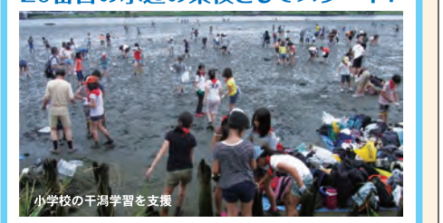
小学校の干涸学習を支援 大田区の大師橋干涸を活動拠点とする「羽田水辺の楽校」が多摩川流域20番目の水辺の楽校としてスタートしました。先輩校の皆さま、よろしく願いいたします。

多摩川の最初一滴から海に注ぐ河口まで。山から海へ向かう138kmの道のりには、多種多様な自然環境が連なっています。多摩川は東京にありながら豊かな自然に恵まれ、全国で最も活動が活発で賑わいある川です。豊かな恵みをもたらす暴れ川の歴史、環境汚染から立ち直った人々の努力など、現在の多摩川は、川と人の関わりの上に成り立っています。近隣の水辺の楽校に足を運ぶと、多摩川全体の姿が垣間見えるかもしれません。