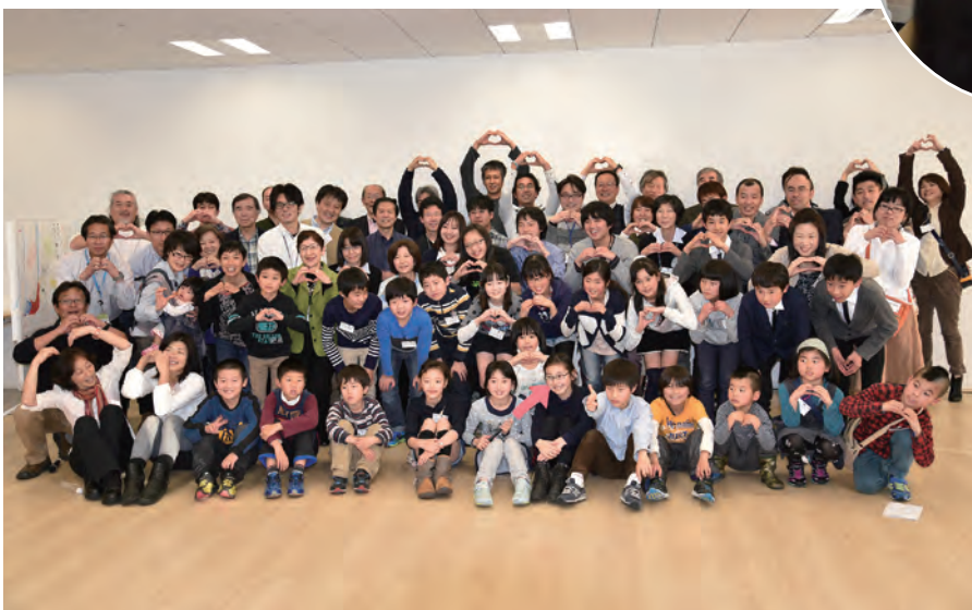
午後も参加した子どもたちで、ハートのポーズの記念撮影。この日はちょうどバレンタインデーでした。

子どもたちの発表は、パワーポイントを使ったり、先生も一生懸命サポート。勉強したことや体験したことを、幼児から高校生まで、いろいろ楽しい工夫をしながら、発表してくれました。