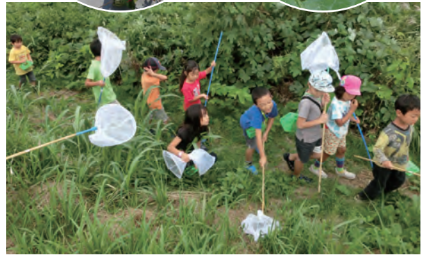
今年最後の草地ガサガサ

この活動は、身近な自然を子どもの育成に役立てたいと願う人たちに支えられています。子どもが遊びながら体験学ぶためには、「自由参加と自己責任」が基本と考えています。参加される方々、および地域の皆様のご理解とご協力をお願いいたします。