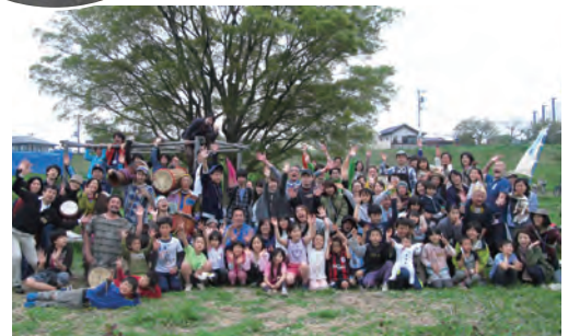
上：開校式の水辺コンサートの様子。 中：多摩川のクズのつるで大縄飛び。回してるのは、地域の学校の先生と二子玉川の企業の方。子どもたちを真ん中に、色んな人がつながるっていいな～。 丸：多摩川チャレンジの渡し船とカヌー 下：NPOお披露目会に集まってくれた皆さん