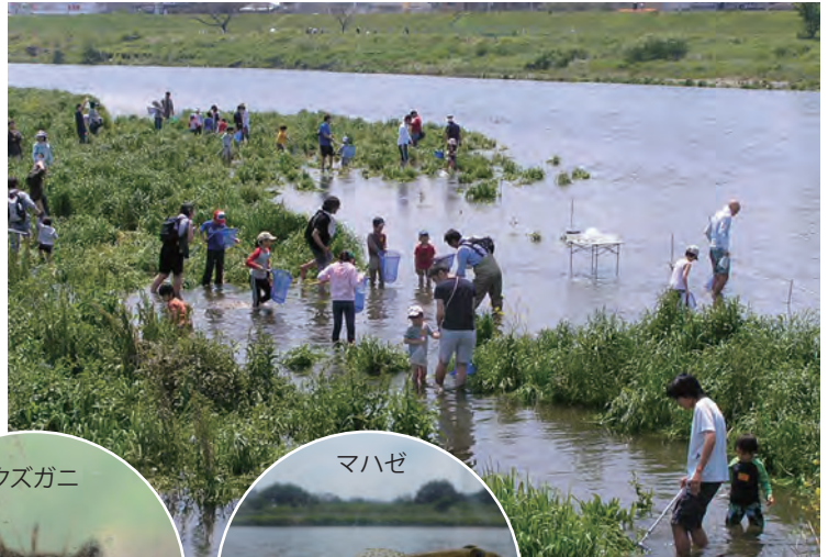
今年最後の水辺ガサガサ

持ち物: シート、のみ物、タオル、着替え 服そう: めれてもいい運動ぐつ、長ズボン